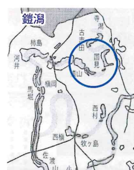
薄い太線が萱刈川(推定)

国見で萱刈川の痕跡を示すものは、国見からは北に向かつて流路を変えたところに「堤」という小字地名が残っており、少し高くなっています。