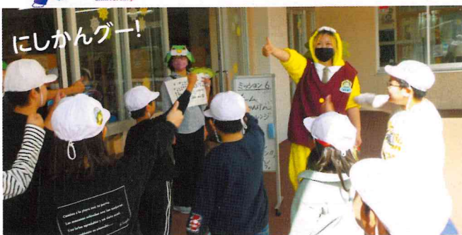
カーター君とじゃんけん勝負!!