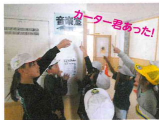
ラッキーカーター君を探せ!

全校登山を予定していましたが、前日の天候が悪かったため、校内で「潟っ子オリエンテーリング」を開催しました。子どもも大人も笑顔でした!