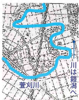
拡大した国見付近と萱刈川

から地名が付けられたのでしよう。出土した坏からは人が生活していたことがわかります。萱刈川は国見の遙か昔の源風景の中にあつたのです。