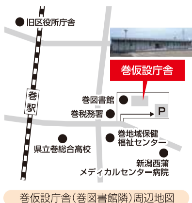
巻仮設庁舎(巻図書館隣)周辺地図