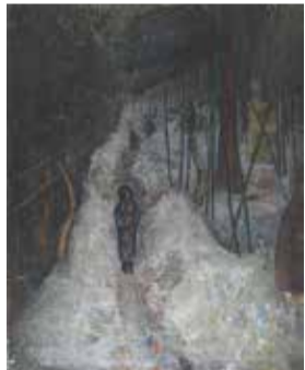
第26回 二科展入選作