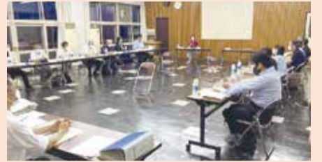
▲新庁舎基本構想検討会議の様子