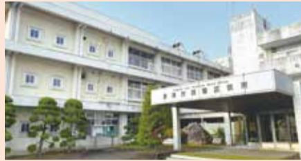
▲現在の西蒲区役所庁舎

西蒲区役所は築後60年以上経過しており、老朽化とともにエレベーターがないなど、高齢者や障がいのある人にとっての障壁を取り除く取り組み(バリアフリーへの対応)が喫緊の課題となっています。今年度は、新庁舎の基本構想を策定することとして、現在準備を進めています。基本構想の策定にあたっては、区民の皆さんから親しまれ、気軽に訪れていただける場となり、あたたかく活力あるまちづくりの中心的存在にふさわしい庁舎とすることを目指します。そのため、公募委員を含めた検討会議を立ち上げ、アンケートを実施するなど、皆さんの声をお聞きしながら進めていきたいと考えています。