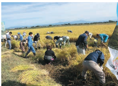
昨年の収穫の様子

☎9月22日(日)午後1時半~(約2時間) ※小雨決行。天候により、延期になる場合があります 持ち物 稲刈り・ハザ掛けができる服装