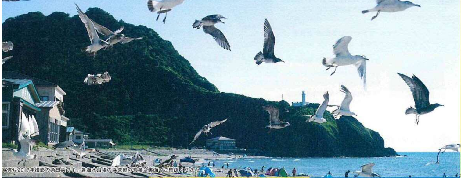
写真は2017年撮影の角田浜です。各海水浴場の浜茶屋の営業は裏面をご確認ください。