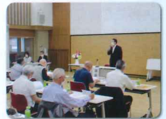
令和5年度定期総会 (R5.5.18)