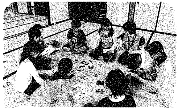
かるたで防災の知恵

今回の運営は、8団体の協働で実施され、連携プレーで子どもたちを見守ると同時に、スタッフたちも充実した時間を過ごされたとのことでした。