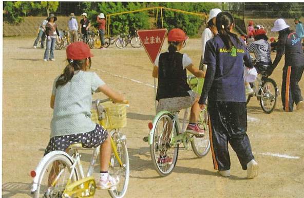
しっかりがんばりましょう

西区役所総務課、安心安全係担当者の指導で行われた。児童たちは、正しい自転車の乗り方や、交通事故を起こさないために、守るべき交通ルールを熱心に勉強していた。