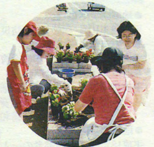
大堀幹線の花づくり