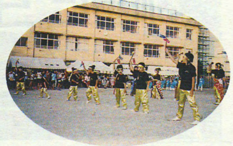
地域ふれあい夏まつり (1,200人が参加)