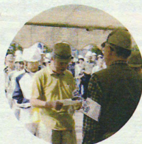
自治会長 人数報告

毎年10月に実施される地域合同防災訓練、(坂井輪小学校グラウンド)今年の参加者は、620名、中学生も参加して会場を盛り上げる。今年も国土交通省のご協力により、起震車による震度5〜7を家族で体験。