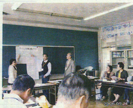
地域福祉活動部会の報告会

「高齢者への友愛訪問や施設ボランティアの活動」「子供から高齢者までの相談・支援活動」「街の安心・安全点検活動」などを行っております。