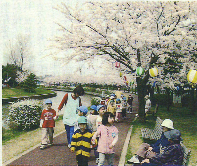
西川の遊歩道の桜並木 (都市緑化功労者表彰を受賞)