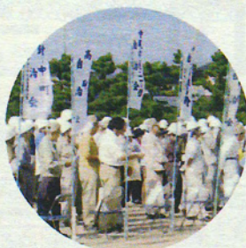
自治会標旗で整列