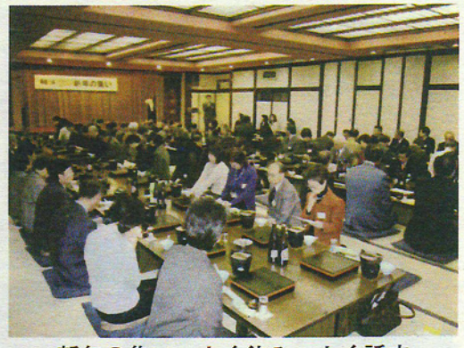
新年の集い・よく飲み、よく話す