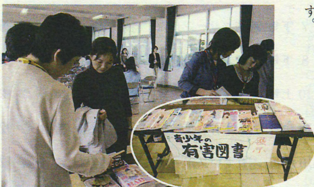
子どもたちには見せたくありません!

「高齢者への友愛訪問や施設ボランティアの活動」「子供から高齢者までの相談・支援活動」「街の安心・安全点検活動」などを行っております。