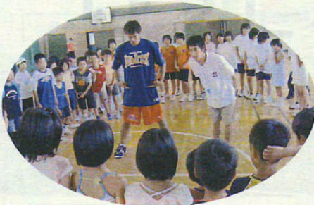
スポーツ教室 よく聞きましょう!