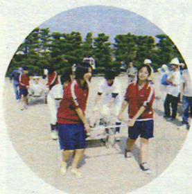
折りたたみ式 リヤカーで救護