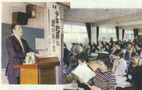
青少年健全育成・まじめに聞きました