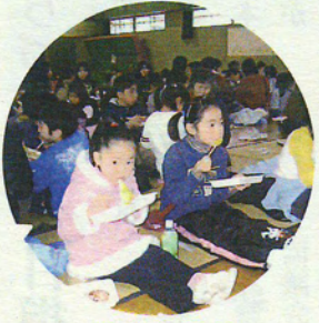
つきたての お餅はおいしいぞ!

西川の遊歩道に桜を植えてから15年が経過、今では立派な桜並木に成長し、新しい桜の名所に!