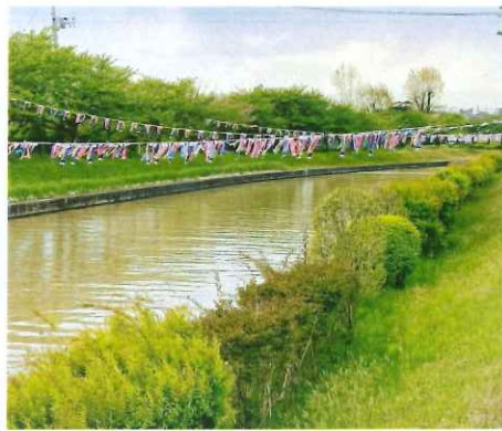
地域のお手伝いあって、500匹の鯉が西川をまたぎました。