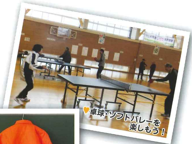
♥卓球・ソフトバレーを楽しもう!