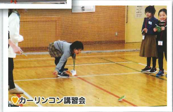
♥カーリングコン講習会