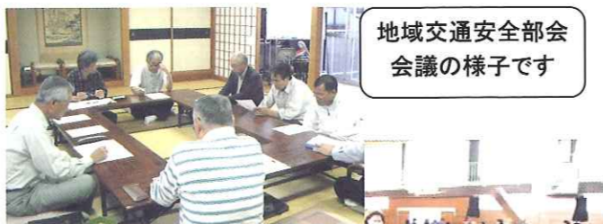
地域交通安全部会 会議の様子です