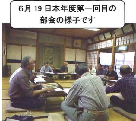
6月19日日本年度第一回目の 部会の様子です