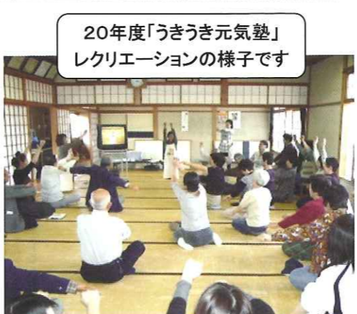
20年度「うきうき元気塾」 レクリエーションの様子です

平成20年度は、健康福祉課の保健師や衛生士・地域の明倫短大の学生さんの協力を得て、「お口は毎日の脳活性化の基本」をテーマとし「お口の健康法」について、真砂会館と坂井輪コミュニティセンターを会場として2回開催しました。講話の後楽しいゲームを取り入れ、参加者皆が和氣藹々とした雰囲気の中で終了しました。今年も「講話や実技（家庭で出来る体操やレクリエーション）」を取り入れた「うきうき元気塾」企画実施致します。