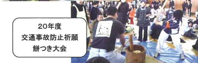
20年度 交通事故防止祈願 餅つき大会