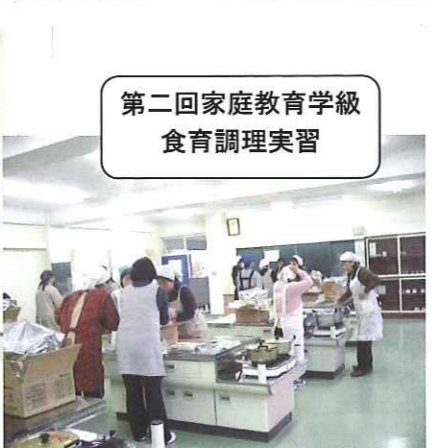
第二回家庭教育学級 食育調理実習