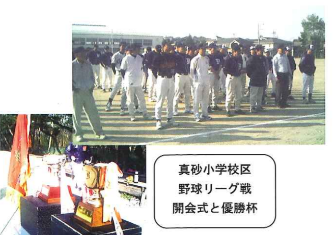
真砂小学校区 野球リーグ戦 開会式と優勝杯

また、野球を通して自治会の活力に貢献出来たらと思っています。5月10日の開会式も無事終わり、9月頃までのリーグ戦をスタートしました。日報しんきん杯親善野球は6月28日トーナメント第一試合が行われ、7月26日（日）真砂1と2、松海1と2で準決勝、決勝戦が行われます。これからは野球以外のスポーツ、誰もが参加できるイベントを部員とともに考え地域の活性化を図りたいと思います。