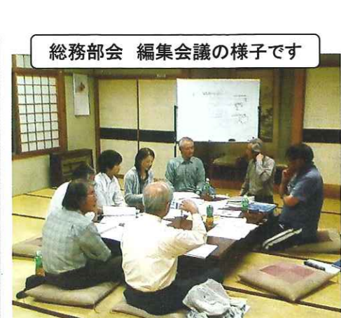
総務部会 編集会議の様子です

一方、事務局と連携して活動するため2名が書記として事務局の仕事も行うようになりました。コミ協の諸会議案内の作成、発送、会議準備、各部会からの情報収集の窓口、西区コミ協や行政との連携、その他事務処理等、事務局と一緒に活動してまいります。まだ思考錯誤の段階で、不手際があるかと思いますが、当コミ協の運営がスムーズに行えるよう、何卒ご協力のほどお願いいたします。