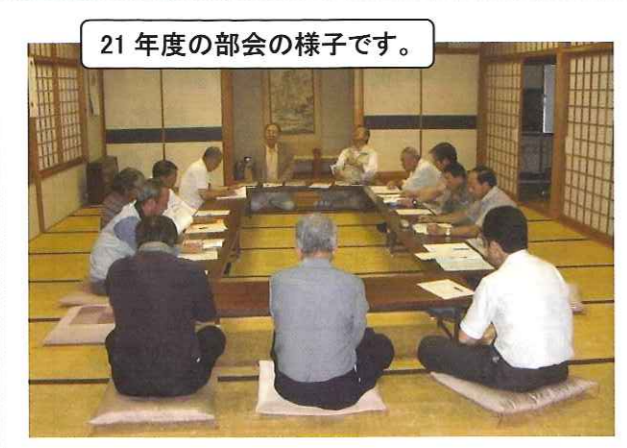
21年度の部会の様子です。