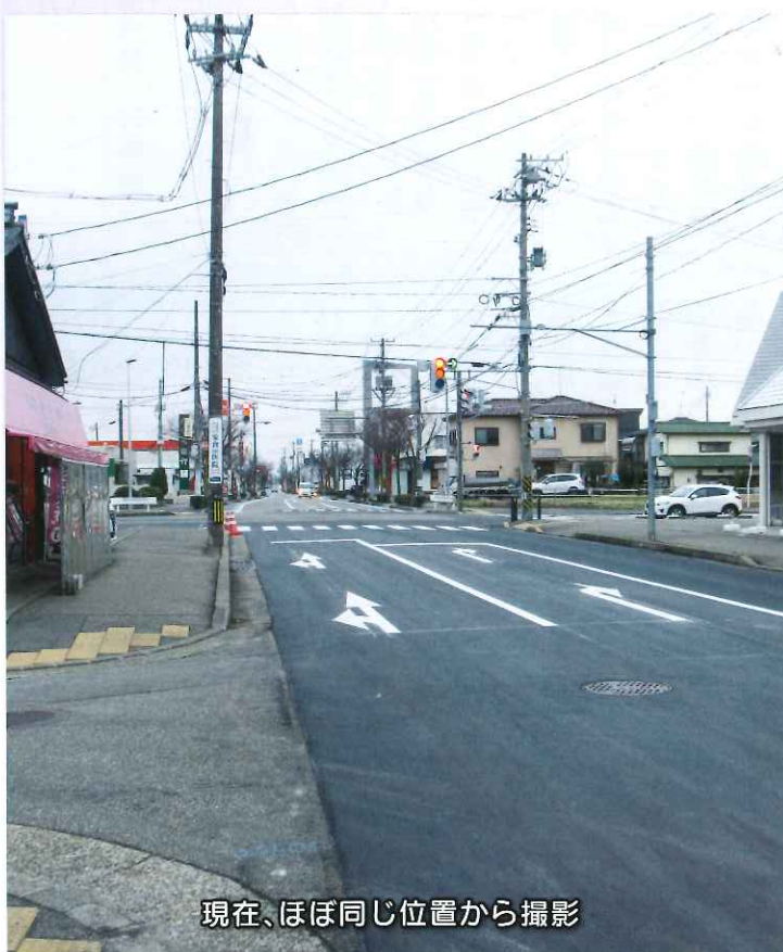
現在、ほぼ同じ位置から撮影