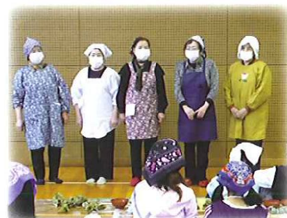
笹だんごづくり名人