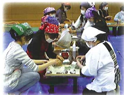
みんなで笹だんごづくり