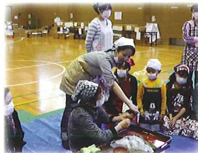
笹だんごづくり講習