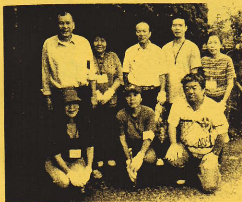
青山新町第3自治会清掃参加の皆さん

生活環境部会は、環境美化運動の一環として「ゴミ拾い運動」を本年七月・九月・十一月の第二日曜日に、各自治会・町内会ごとに実施することを提案した。九月十五日(土)実施の青山新町第3自治会を総務部会が取材した。当自治会は、午前八時・八名が集合し、二組に分かれ約一時間ごみ拾いを実施した。参加者からは、「ポイ捨てする人のモラルの低さに驚いた」等の声が寄せられた。また、生活環境部会は、九月に「ごみ拾い運動」に関するアンケートを実施、その結果は、次のとおりでした。