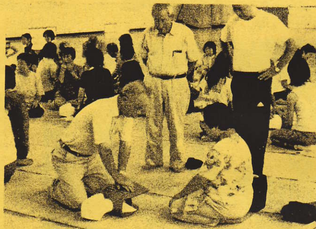
日赤の指導で救急救命法を実習中