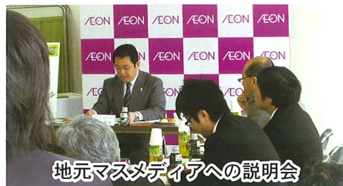
地元マスメディアへの説明会

コミュニティ広場の利用方法につきましては「準備委員会」をつくり検討中です。決まりましたら地域の皆さまに広報いたします。よろしくお願いいたします。