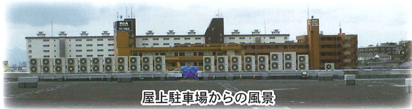
屋上駐車場からの風景