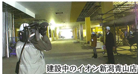
建設中のイオン新潟青山店

先日（2/19）、イオン新潟青山店は地元マスメディア（新聞社、テレビ局）に新店舗見学会を実施しました。当コミ協広報部も参加しました。上の写真は、その時撮影した新店舗です。