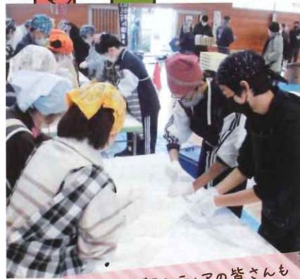
中学生ボランティアの皆さんも参加しました