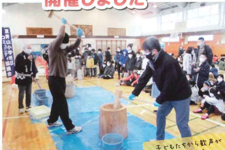
子どもたちから歓声があかりました