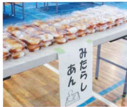
あんこ、きなこ、みたらしあんの3種類を用意しました。参加者の皆さんには、つきたてのおもちを持ち帰り、ご自宅で楽しんでいただきました。

会場にて募金活動を行いました。皆さんからお預かりした総額3,145円は共同募金会に寄付いたしました。