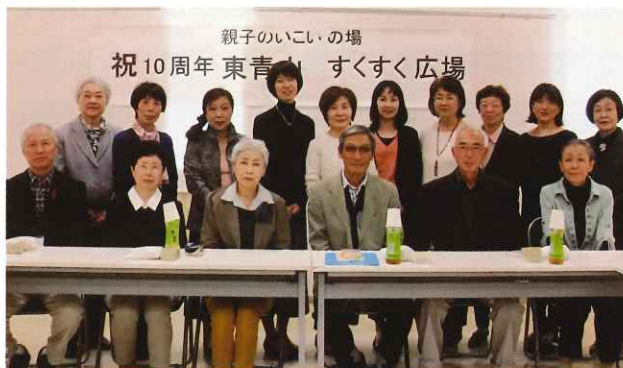
10年間ですくすく広場に携わってくれたスタッフの皆様