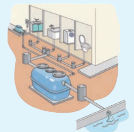
合併処理浄化槽のイメージ

申し込み期限 交付申請: 令和9年2月1日(月)まで(実施報告: 令和9年3月15日(月)まで)