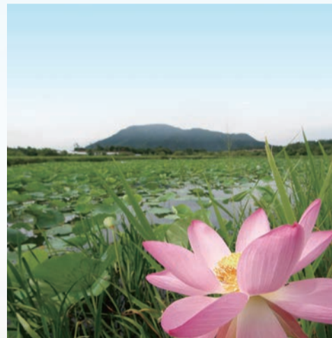
平成30年以前の佐潟

佐潟では、平成30年ごろまで夏になるとハスの花が咲き、水辺を美しく彩っていました。7月～8月にかけて、ピンクや白の花が一面に広がる景色は、多くの人に親しまれてきた季節の風物詩です。朝に開き、昼には閉じる花の姿を楽しみに、足を運ぶ人の姿も見られました。しかし、環境の変化などによりハスは次第に数を減らし、やがてその姿は見られなくなりました。こうした失われた風景を取り戻そうと、ハス復活プロジェクトが始まっています。