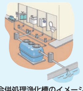
合併処理浄化槽のイメージ

申し込み期限 交付申請: 令和9年2月1日(月)まで(実施報告: 令和9年3月15日(月)まで)