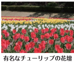
有名なチューリップの花壇

寺尾中央公園ぐるりコースは、四季折々の花々を楽しみながら歩ける魅力的なコースです。春は色鮮やかな花が園内を彩り、やさらかな空気の中で心地よい時間を過ごせます。園内は休憩スポットも点在しているため、無理なく自分のペースで楽しめるのも魅力。自然に囲まれながら、心も体もリフレッシュできるウォーキングをお楽しみください。