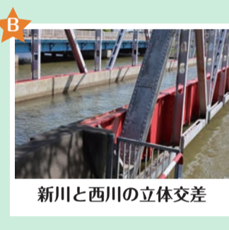
新川と西川の立体交差