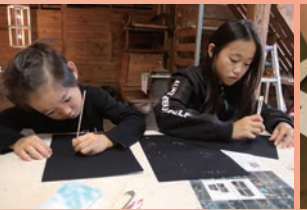
こどもも大人も楽しめるワークショップ