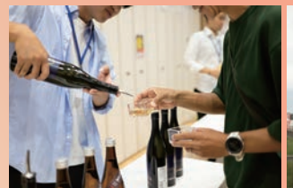
多くの人が訪れたイベント