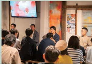
大盛況だったトークイベント