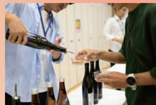
多くの人が訪れたイベント