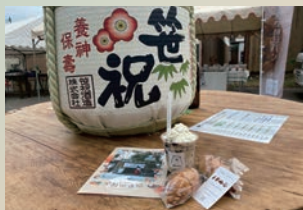
西・西蒲区の酒蔵で同時蔵開き