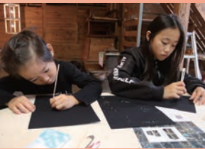
こどもも大人も楽しめるワークショップ