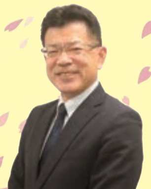
新潟市西区長 水野利数

今年度も、区民の皆さまとともに、承継と刷新の精神でチャレンジしてまいりますので、ご理解とご支援、ご協力のほどよろしくお願い申し上げます。