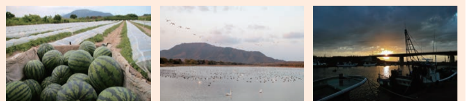
豊かな農作物を育む砂丘 ラムサール条約湿地 佐潟 新川大橋から見る夕日

第3部会では、昨年度、西区に住む人が今以上に西区を好きになり、末長く住み続けたいと思ってもらえるよう、西区の魅力を発掘し、「西区八景」を選定しました。今年度は、八景に関する活動やさまざまな写真などを区ホームページ(右の二次元コード)を通じて発信していきます。