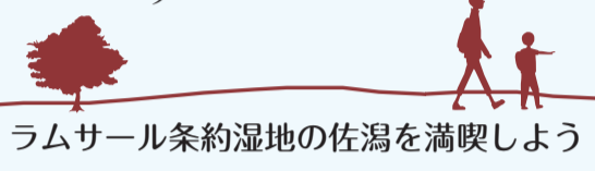
ラムサール条約湿地の佐潟を満喫しよう

日時 6月3日(土)午前9時～11時(小雨決行) 集合場所 佐潟水鳥・湿地センター 定員 小学生以上 先着12人(小学生は保護者1人同伴) 持ち物 野外で活動しやすい服装、帽子、飲み物、筆記用具、双眼鏡(貸出可) 申し込み 10日(水)から電話または直接同センター