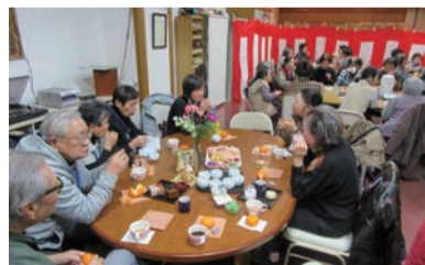
地域の茶の間サロン

高齢者のお茶の間サロンなどに月3回程度参加し、参加者の話に耳を傾けています。また、地域の行事などにも積極的にに関わり、顔つなぎをしています。そこで支援を必要としている人がいたら地域包括支援センターなどの専門機関につないでいます。