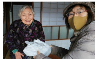
見守り訪問でコミュニケーション

月に1回、70歳以上の高齢者の見守り訪問をして、会話や生活の様子に少しでも異変がないか気にかけています。また、年に3回、高齢者の集いの場「ふれあい会」を企画し、落語や保健師による健康体操などを行っています。