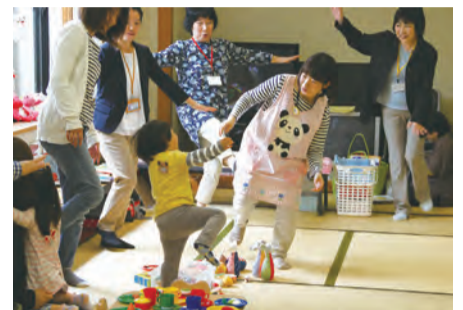
みんなで楽しくリズム体操