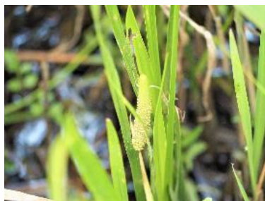
〈 ショウブ 〉