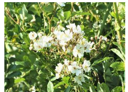
〈 ノイバラ 〉