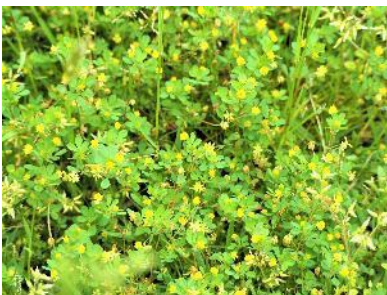
〈 コメツブツメクサ 〉

オオイヌノフグリ、ノゲシ、ヒメオドリコソウ、コハコベ、タネツケバナ、ミチタネツケバナ、オランダミミナグサ、ツクシ（スギナ）、ホトケノザ、ダイコンソウ、ユキノシタ、ヨモギ、スズメノヤリ、タチイヌノフグリ、ハルノノゲシ、ナズナ、シロイズナズナ、サギソウ、セイヨウタンポポ、ショウブ、ツルボ、ハルガヤ、スズメノテッポウ、カキドオシ、ムラサキサギゴケ（サギゴケ）、ハルジオン、ヤブニンジン、スズメノカタビラ、オオスズメノカタビラ、カラスノエンドウ、カスマグサ、スイバ、ヒメスイバ、オヤブヅラミ、ヒゲナガスズメノチャヒキ、オニウシノケグサ、スズメノヤリ、カタバミ、ハナニガナ、ムラサキケマン、アマドコロ、スカシタゴボウ、コメツブツメクサ、タチイヌノフグリ、ハマワスレナグサ、カラスムギ、シロツメクサ、イヌムギ、ヌカススキ、ヌカボ、コウホネ、フトイ、ホタルイ、ケキツネノボタン、ニワゼキショウ、マンテマ、オオマルバノホロシ、コナスビ、ウキヤガラ、ヒシ、ヒメジョン、チチコグサ、ギシギシ、オニノゲシ、オニタビラコ、ナワシロイチゴ、ノアザミ、ウシノケグサ、クサヨシ、ギシギシの仲間、ドクダミ、ブタナ、ムギグサ、キツタ、アケビ、ゴヨウアケビ、ヤツデ、ヤブツバキ、アオキ、モッコク、トベラ、エノキ、ナワシログミ、ヤブツバキ、タチヤナギ、コブシ、ソメイヨシノ、オオシマザクラ、クワ、オニグルミ、ヤエザクラ、クヌギ、ウバメガシ、コマユミ、ケヤキ、コナラ、フジ、ヒョウタンボク、ニワトコ、グミ、クワ、アカメガシワ、タブノキ、エゴノキ、ノイバラ、ネムノキ