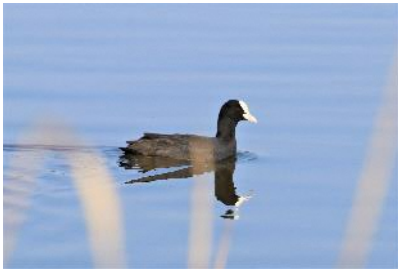
〈 オオバン 〉

キジ、マガン、ヨシガモ、ヒドリガモ、マガモ、カルガモ、ハシビロガモ、コガモ、ホシハジロ、キンクロハジロ、カイツブリ、カンムリカイツブリ、キジバト、カワウ、ゴイサギ、アオサギ、ダイサギ、コサギ、オオバン、カッコウ、タシギ、セグロカモメ、トビ、カワセミ、コゲラ、モズ、オナガ、ハシボソガラス、ハシブトガラス、シジュウカラ、ヒバリ、ツバメ、ヒヨドリ、ウグイス、エナガ、メジロ、オオヨシキリ、コヨシキリ、ムクドリ、コムクドリ、ノビタキ、コサメビタキ、スズメ、ハクセキレイ、セグロセキレイ、カワラヒワ、ホオジロ、カシラダカ、アオジ、オオジュリン