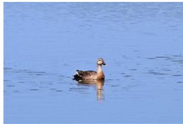
〈 カルガモ 〉