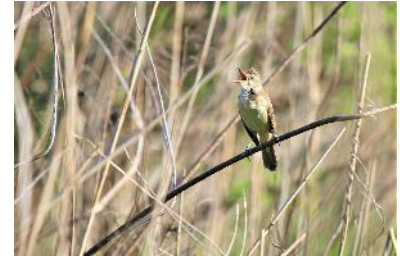
〈 オオヨシキリ 〉