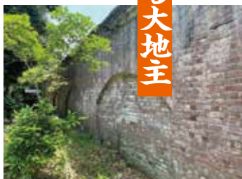
イギリス積みのレンガ塀

い、小作人481戸を有する大地主になりました。2018(平成30)年5月には、主屋、離れ、表門及び塀、煉瓦塀、裏門及び塀、煉瓦塀、イギリス積みが、国の登録有形文化財に登録されました。