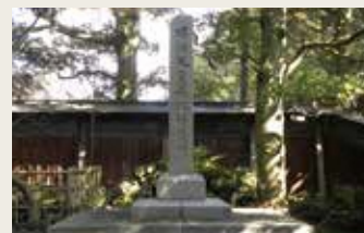
明治天皇赤塚行在所碑