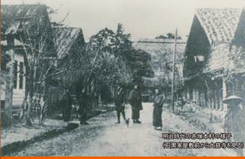
明治時代の赤塚本村の様子 (石黒家屋敷前から大慈寺を見る)

赤塚はかつて、新潟・弥彦間の「北国街道(北陸道)」の中間地点に位置し、在郷町として栄えました。北国街道を通り、文人墨客・大名・皇族など名立たる人も訪れました。昭和50年代まで、佐潟や御手洗瀧は赤塚地域の生活の一部として利用された里瀧で、瀧から得られる産物は赤塚名物として知られていました。