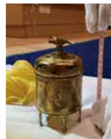
佐々木象堂《金銅海鷲香炉》 (1935年頃、当館蔵)調査の様子