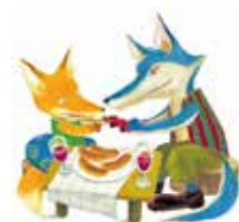
「からすのパンやさん」1973年 偕成社 ©Kako Research Institute Ltd.1973