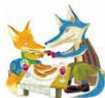
「ともだちや」1998年 偕成社 ©Rintaro Uchida, Nana Furiya

一般当日 1,600円 休館日 月曜日(ただし6/15、7/20、8/10・24は開館)