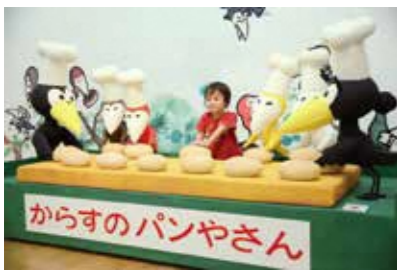
「からすのパンやさん」1973年 偕成社 ©Kako Research Institute Ltd.1973

「絵本の中に入ってみたい」と思ったことはありませんか。本展はその夢を叶える、全身を使って体感できる展覧会です。会場内には世代を超えて愛される7冊の絵本をテーマにした空間が広がり、まるで絵本の中に迷い込んだかのような感覚を味わうことができます。工作コーナーや映像コーナーでは、視覚、触覚、聴覚などを使った体験ができ、約800冊の絵本が設置された「絵本の森コーナー」では、お気に入りの絵本との出会いをお楽しみいただけます。貴重な絵本原画も約40点展示します。お子様のミュージアムデビューにもおすすめです。