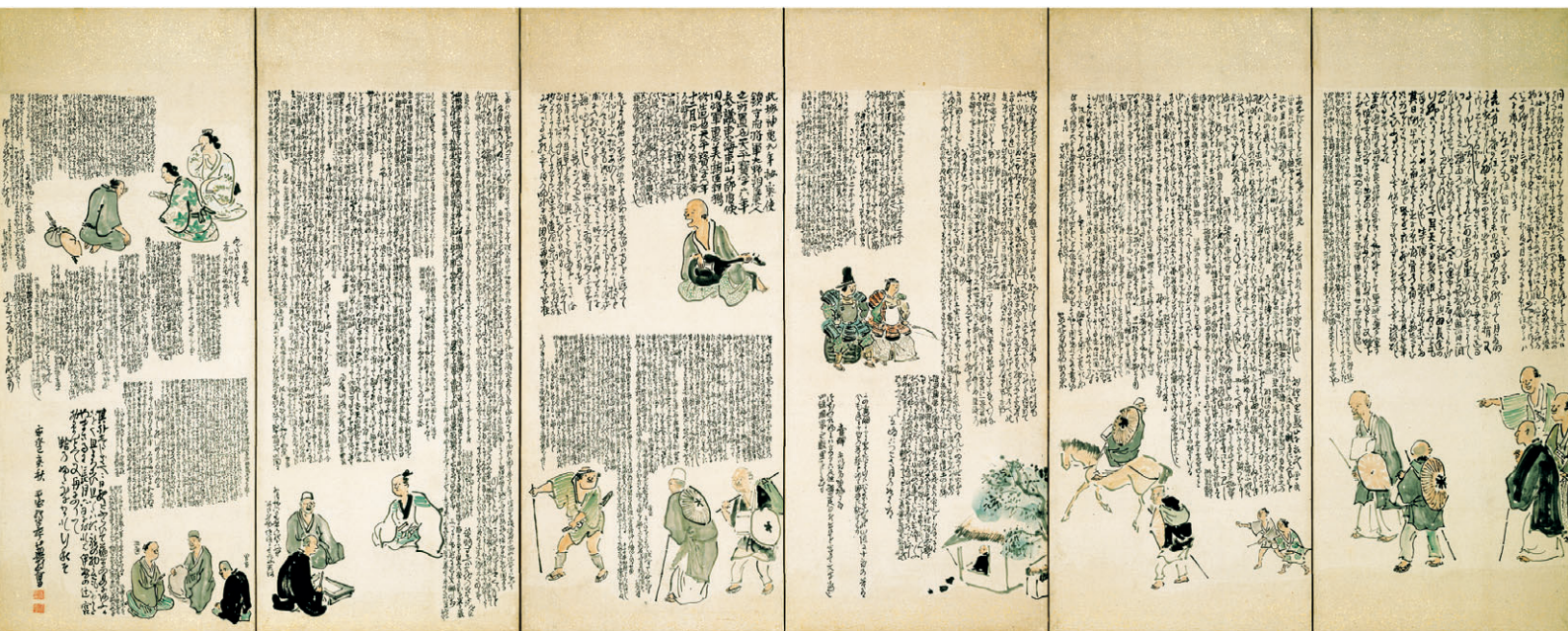
与謝蕪村《奥の細道図屏風》安永8(1779)年 山形美術館 ④長谷川コレクション ※前期のみ展示

重要文化財 与謝蕪村《奥の細道図屏風》から、 高橋由一・黒田清輝・ユトリロ・ローランサン・シャガールまで 優品一挙公開