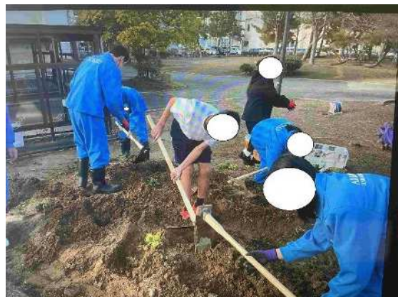
6、学校の畑で土づくりを行う生徒の様子