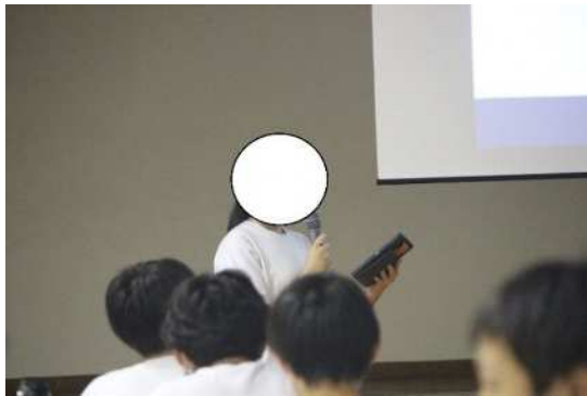
5、前期の発表会で農業体験について全校に向けて発表する様子