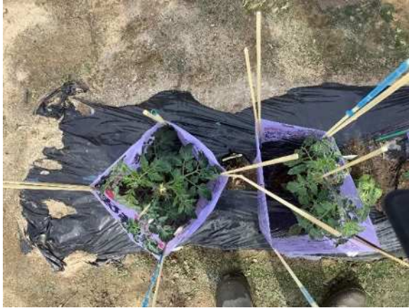
3、苗に囲いを行い、風から守る作業