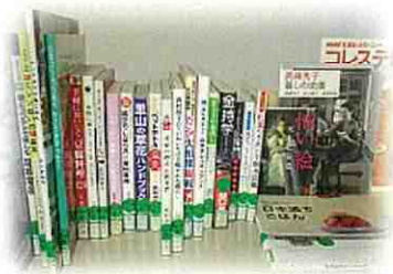
バラエティセット