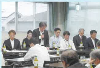
副区長・各関係課長