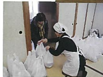
「味が美味しい」「種類が豊富」「お年寄り向きに作ってあり、食べやすかった」など、食べた方から感想が寄せられました！