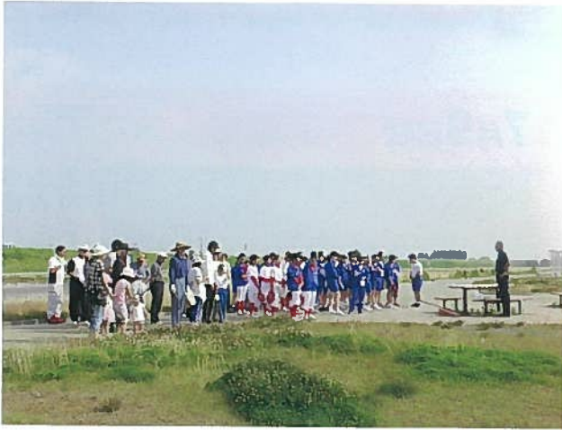
「白井・大郷フルーツフラワーの里公園」を中学生と地域の皆様が清掃してくださいました。