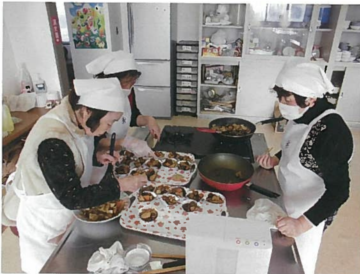
手作りで美味しい一品を作っています！