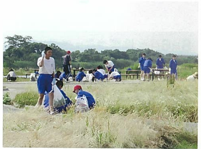
私たちの公園です。次に利用する人の事を考えていつもきれいに利用しましょう。