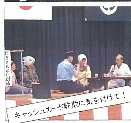
キャッシュカード詐欺に気を付けて！