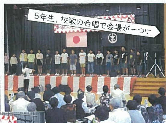
5年生、校歌の合唱で会場が一つに