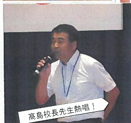
高島校長先生熱唱！