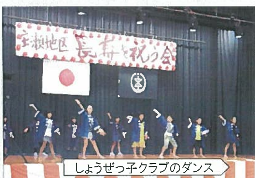
しょうぜっ子クラブのダンス