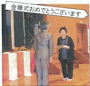
金婚式おめでとうございます

9月23日 庄瀬小学校体育館にて開催。ご長寿の皆さんと出演者、歌に踊りに寸劇にと大いに笑って楽しい時間を過ごしました。台風の影響で急に気温が上がりまさかの夏日でしたが、多くの方に参加していただき大変嬉しく思います。