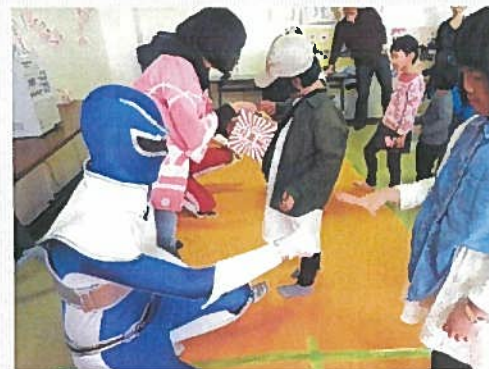
▲ジャンケンで景品ゲット