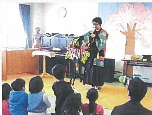
▲初めてのマジックにドキドキ