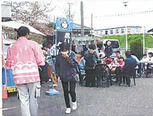
▲ところ狭しと飲食店が