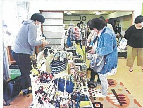
▲かわいい雑貨販売