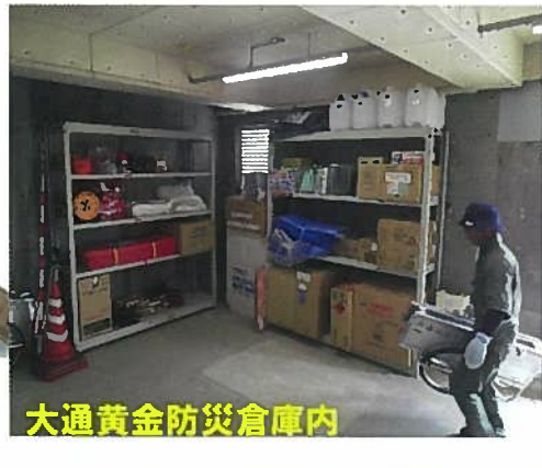
大通黄金防災倉庫内