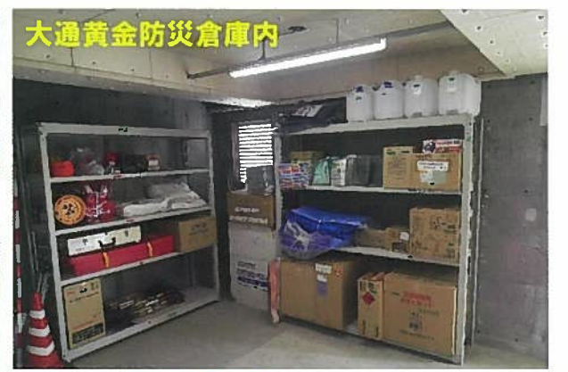
大通黄金防災倉庫内