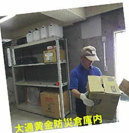
大通黄金防災倉庫内