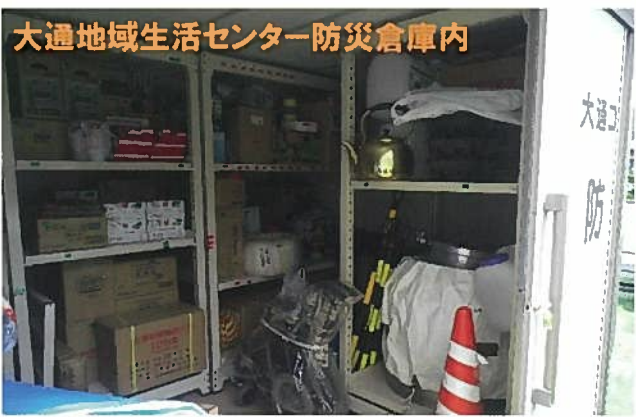
大通地域生活センター防災倉庫内