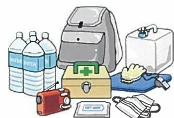
※新潟市地区別防災カルテ(大通小学校区) 参照

日頃から家族や友人、地域住民と、いざという場合に備えて連絡体制と防災備品を備えましょう！