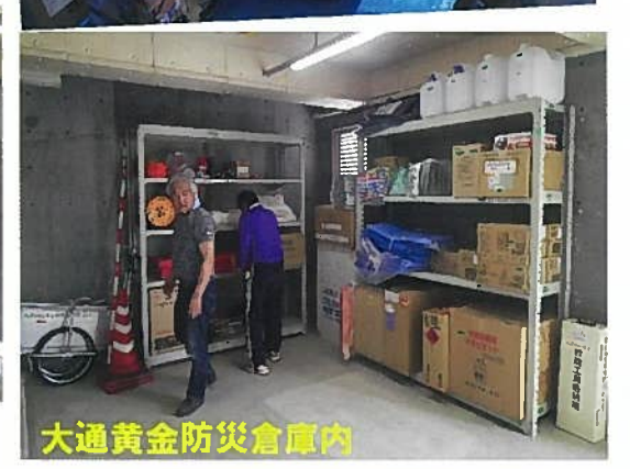
大通黄金防災倉庫内