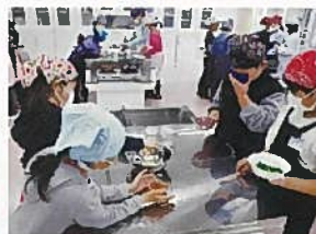
大通小学校の4年生も調理実習で作りました