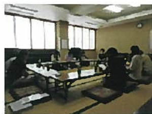
<スタッフ ミーティングの様子>

H31年1月1日～R1年12月31日現在 (1件あたりの作業時間は1～2時間程度です。)