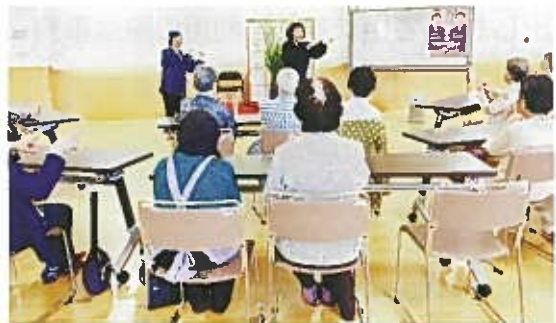
9月12日 秋を楽しむ会