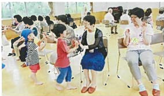
6月27日 大通保育園児との交流