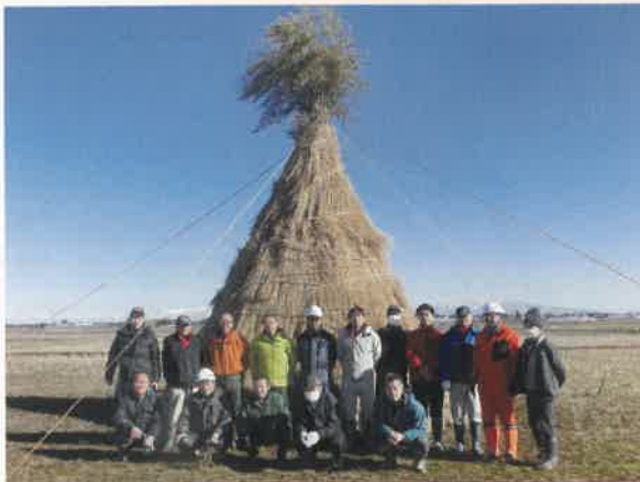
完成です。ご苦労様でした。