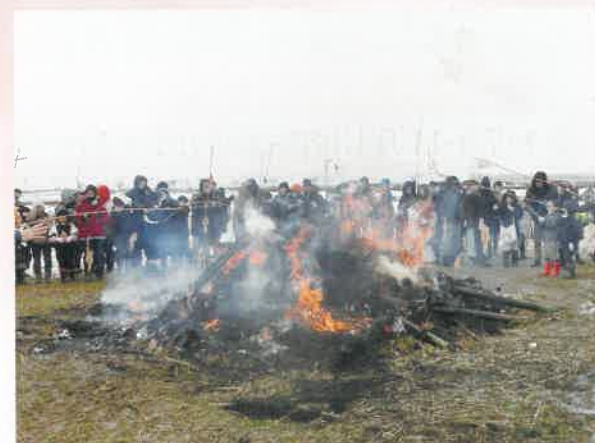
あたりめを焼いて食べて健康な1年