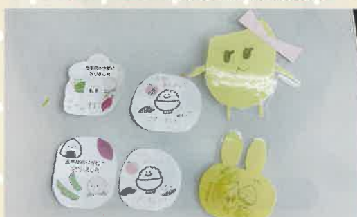
お土産をもらいましたよ。