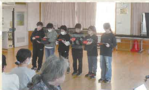
学習発表をしてもらいました