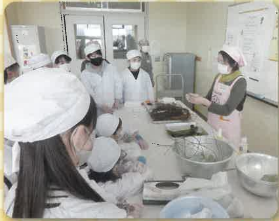
笹の包み方を習います