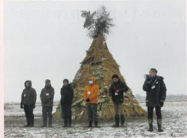
1月12日オープニングセレモニー