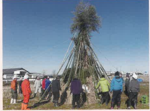
令和8年1月10日(土) 櫓組み立て