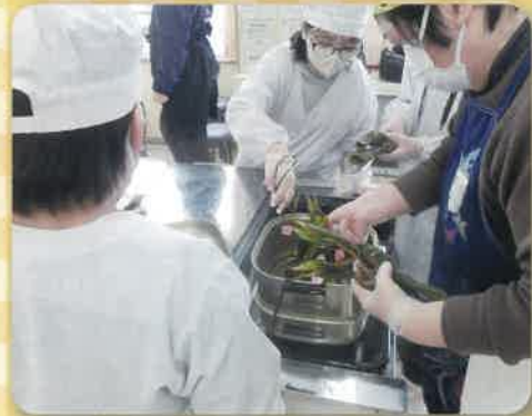
蒸かします うまくいかな