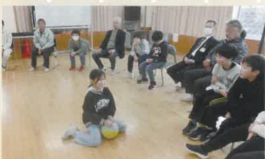
みんなでゲームを楽しみました。