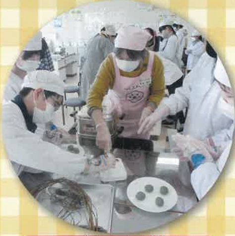
あんこを草餅で包みます