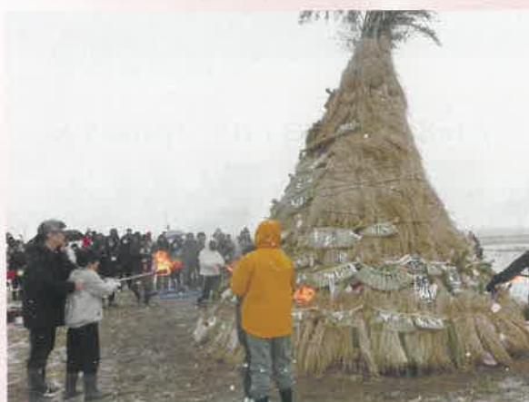
年男・年女による点火