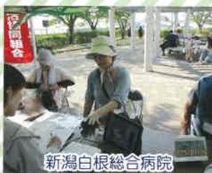
新潟白根総合病院