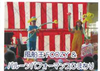
風船王 FOOZY & パールンパフォーマンズのまわり