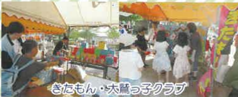
きたもん・大鷲っ子クラブ