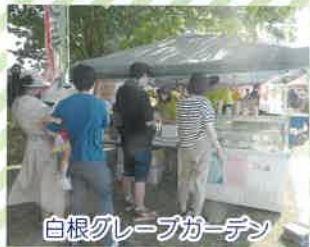
白根グレープガーデン