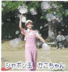
シャボン玉 ガこちゃん