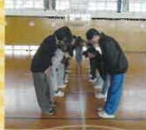
中学生も遊びに来てくれました