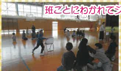
班ごとにわがれてジェスチャーゲーム