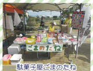
駄菓子屋ごまのたね