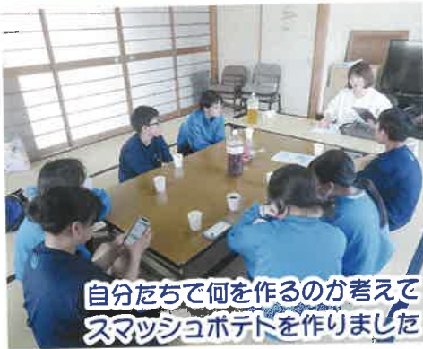
自分たちで何を作るのが考えて スマッシュポテトを作りました