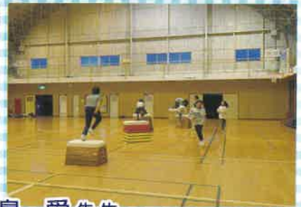
健康運動指導士 高島 善史先生 高島 愛先生