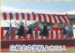
白根北中学校よさこい