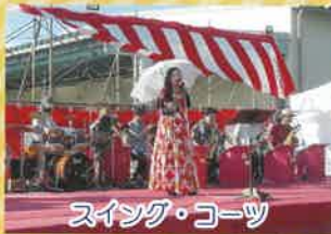
スイング・コーツ