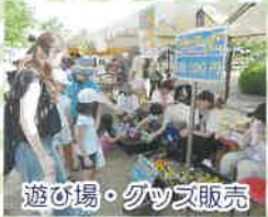
遊び場・グッズ販売