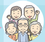
月寿荘の常連の皆さん

お風呂に入って、友人とおしゃべりをして過ごし、持ってきたお昼ご飯を食べて、午後2時ごろに帰るのが日課です。月に2回ほどカラオケもあって、歌を聞きながら楽しい時間を過ごしています。みんなで集まることができ、自由に楽しく過ごせる憩いの場所です。