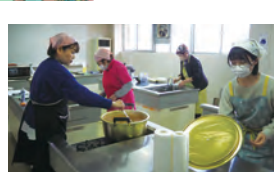
12:00 いただきます この日は、学生ボランティアも参加して、100人分のカレーを作っていました。