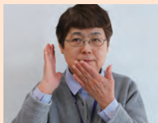
右手を耳、左手を口に当てる