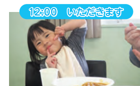
カレーは甘口・中辛・辛口から選べます。おいしいご飯でみんな笑顔に!

幼児から高齢者まで幅広い年代が参加していました。中学生以下は無料、大人は一人300円で参加することができます。次回は8月23日(日)に開催予定です!