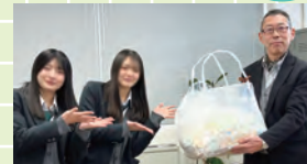
使用済み切手を届けました!

白根高校は、南区とにいがた南区創生会議と連携協定を結び、地域と協同した活動を続けてまもなく5年目を迎えます。「地域の中の白高」として、全校ボランティアや「総合的な探究の時間」の授業でも、地域の皆さんとの交流から多くの学びを得ています。