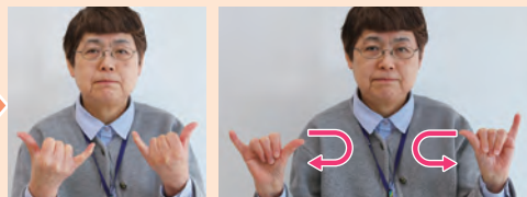
親指と小指を立て、その手を胸側・外側とパタパタさせながら広げる