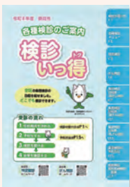
案内冊子「検診いっ得」

「検診いっ得」17~22ページの「施設検診 委託医療機関一覧表」から、受診機関を選びましょう。 予約が必要な場合もあるので、事前に電話で問い合わせてください。