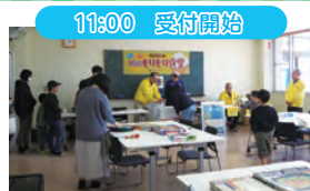
11:00 受付開始 こどもにはお菓子のつかみ取りやポップコーンのプレゼントもありました!

今回は、白根ライオンズクラブが主催する「昭和もりもり食堂」(白根地域生活センター)取材しました。地域や年齢関係なく、誰でも参加できることも食堂です!