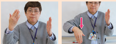
右手の手のひらを顔側、左手は手のひらを内側にする。→右手を下げる