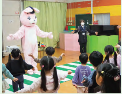
歌とダンスで交通ルールを学びます♪

知人から声をかけられたことがきっかけで、交通安全指導員になりました。はじめは「自分に務まるかな」と不安を感じることがもありましたが、活動の中で触れ合う子どもたちの笑顔がやりがいとなり、あっという間に26年が過ぎていました。 指導員の主な活動として、区内の保育園・幼稚園、小・中学校での交通安全教室を行っています。クイズやダンス、模擬信号機で横断歩道を渡る練習などを通じて、楽しみながら交通ルールを覚えられるよう工夫をしています。