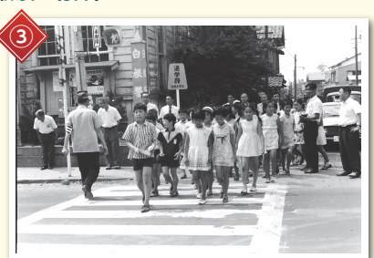
③ 初めて歩行者がボタンを押す「手押し式信号機」が設置された場所です!