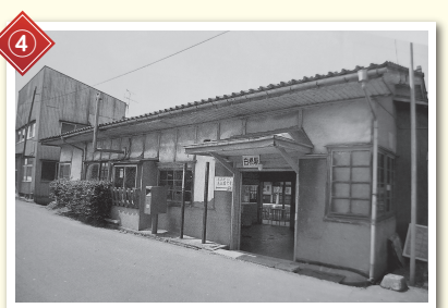
④ この建物は駅舎です