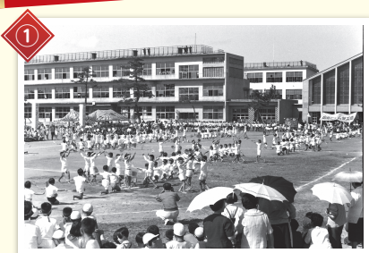
① 小学生が運動会をしています。後ろに写っているのは〇〇中学校!