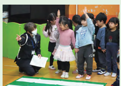
しっかりと手を挙げて「渡るよサイン」を練習します

交通ルールは子どもたちの生活のすぐそばにある、とても「身近なお約束」です。交通事故は一度起きてしまったら取り返しがつきません。だからこそ「どうして止まるの?」「どうして左右を見るの?」という基本を、幼児期から自然に身に付け、自分の命を守れるようになってほしいと思います。 現在、味方地区の指導員は私一人だけになりましたが、子どもたちが事故に遭うことがなく、そして笑顔で成長していけるよう、これからも交通安全の大切さを伝え続けていきたいです。