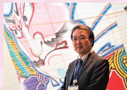
南区長 五十嵐 雅樹

風通しのいい区役所づくりをさらに進め、職員一同全力で取り組んでまいります。区民の皆さまのより一層のご理解とご協力をお願い申し上げます。