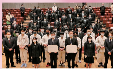
白根高校との連携協定締結式の様子