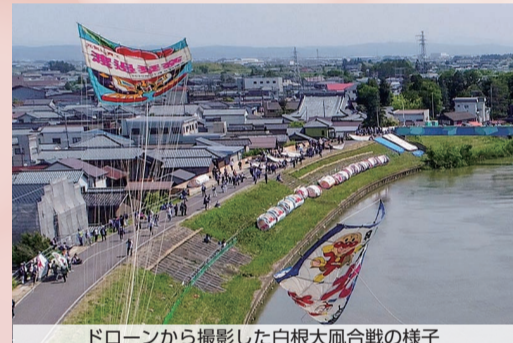
ドローンから撮影した白根大風合戦の様子