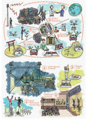
未来ビジョン イメージ図の一部