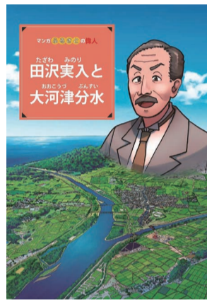
Supported by THE NIPPON FOUNDATION B&G